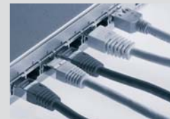
IT-Industrie & Dienstleister